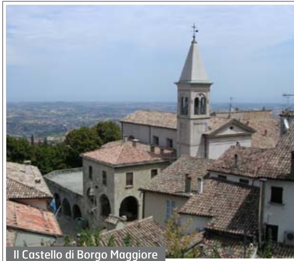
Il Castello di Borgo Maggiore

Appuntamenti: mercoledì a Dogana (Centro sociale) e Borgo (Casa del Castello), sempre alle 20,30