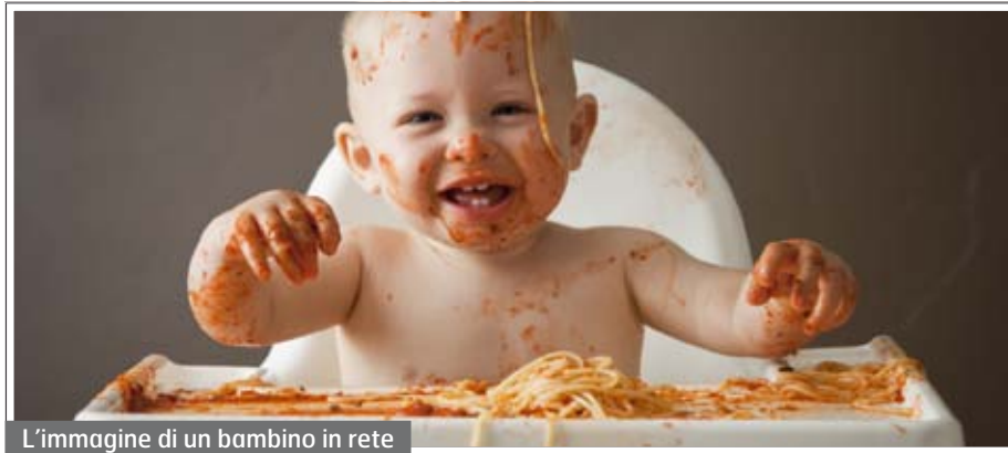
L'immagine di un bambino in rete

Sempre più genitori decidono di non condividere informazioni sui propri figli. Il timore è che qualcuno possa utilizzare a sproposito immagini e dati sensibili. Ma esiste anche un rischio per la sicurezza