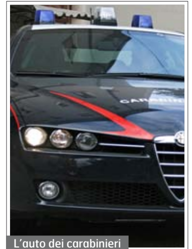
L'auto dei carabinieri

Al momento non è noto da quanto tempo il signore si aggirasse in zona e se abbia perso la memoria. I militari hanno prestato subito i primi soccorsi ma purtroppo essendo privo di do-