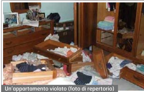
Un'appartamento violato (foto di repertorio)

Entrambe le intrusioni si sono verificate dal portoncino che non era chiuso a chiave, in nessuno dei due era presente un allarme