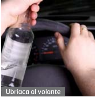
Ubriaca al volante