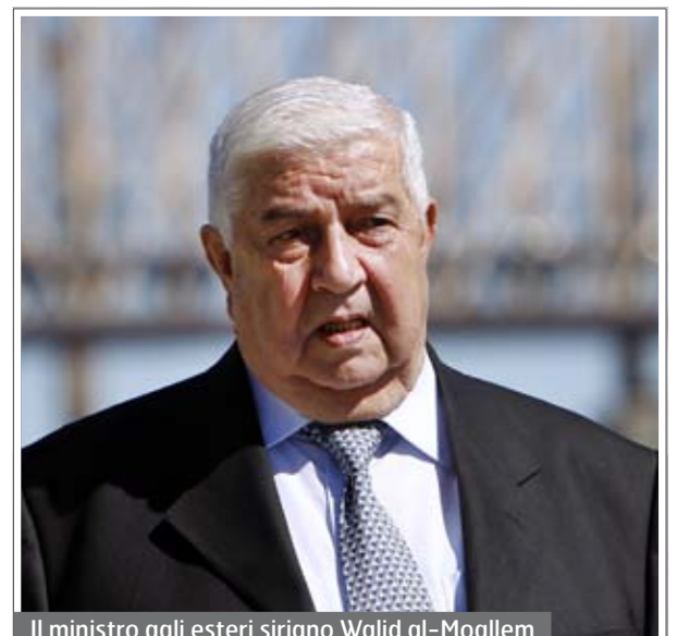
Il ministro agli esteri siriano Walid al-Moallem

fruire il proprio aiuto per far fronte alle crescenti minacce dello stato islamico avvertendo però gli Stati Uniti che gli attacchi sul proprio territorio dovranno essere autorizzati da Damasco perché altrimenti essi saranno considerati alla stregua di aggressioni. Il ministro agli esteri siriano Walid al-Moallem ha dichiarato che il governo è pronto a collaborare e cooperare con qualsiasi parte, compresi gli Stati Uniti, e di partecipare a qualunque alleanza regionale o internazionale per combattere il terrorismo islamico. Ma ha anche detto che ogni azione che coinvolga la