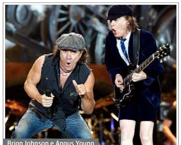
Brian Johnson e Angus Young

Ma chi sono i Big Gun? I Big Gun nascono nel giugno 2006 dalle ceneri della Tribute Band Route66 che contava numerose ed importanti performances nei più famosi locali e rock club dell'Emilia Romagna (Area51 Riccione, Ghinea Pub Marina di Ravenna, Madigans Pub Cesenatico, Boulevard Misano, Transylvania di Bologna, House of Rock di Rimini) e altrettanti concerti in occasione di grossi motora-