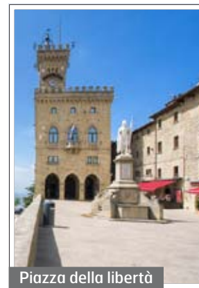
Piazza della libertà