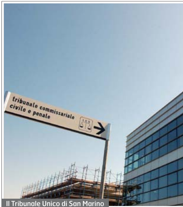
Il Tribunale Unico di San Marino

"L'idea che il medesimo magistrato che ha svolto le indagini sia anche il decidente in quella fase appare, anacronistico e pericoloso"