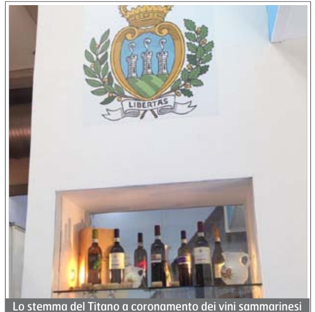
Lo stemma del Titano a coronamento dei vini sammarinesi

Dopo la giornata di ieri dedicata allo sviluppo economico, oggi, mercoledì 27 agosto, ospite presso lo stand della Repubblica di San Marino al Meeting di Rimini, tutto il mondo della tradizione enogastronomica sammarinese con i prodotti del Consorzio Terra di San Marino.