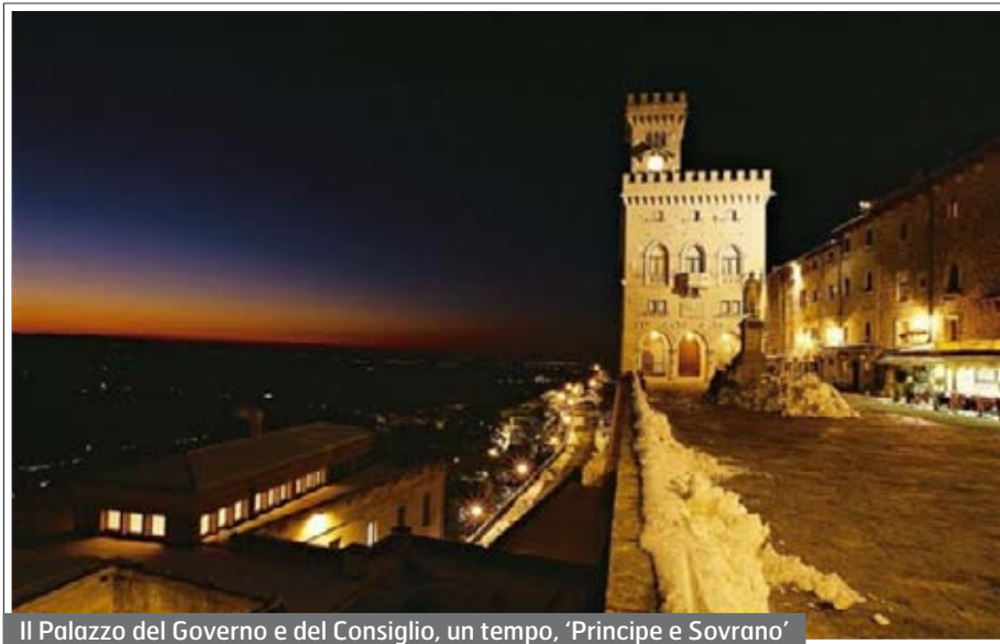
Il Palazzo del Governo e del Consiglio, un tempo, ‘Principe e Sovrano’

La questione morale dipende dalla questione