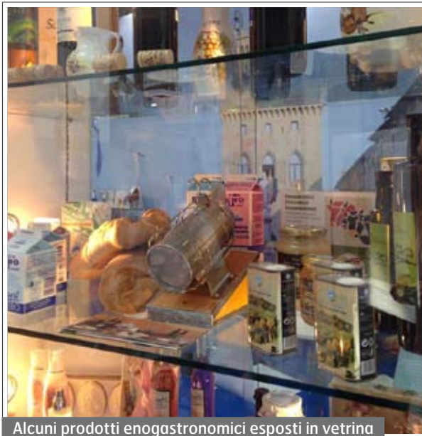
Alcuni prodotti enogastronomici esposti in vetrina

Il Titano mette in mostra i propri gioielli del comparto agricolo e delle produzioni locali, promuovendo in modo sinergico l'intero sistema paese