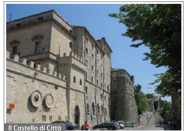
Il Castello di Città